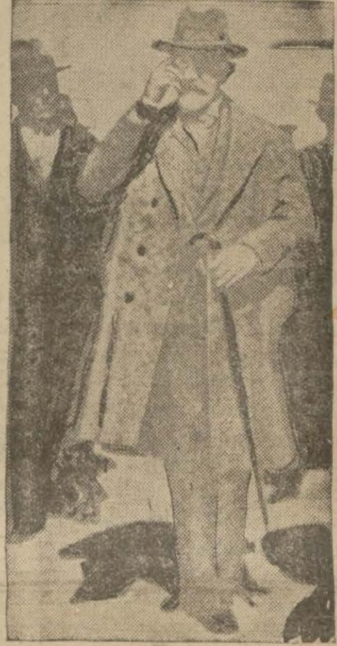
İstanbul Saygılı Bay Abdülhak Hâmit

İstanbul, 27 (Hususi) — Belediye meclisi Esnaf Bankasının tasfiyesine karar vermiştir.