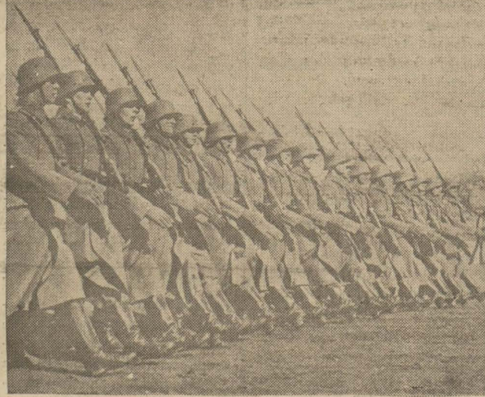
Alman Ordusundan Bir Müfrez